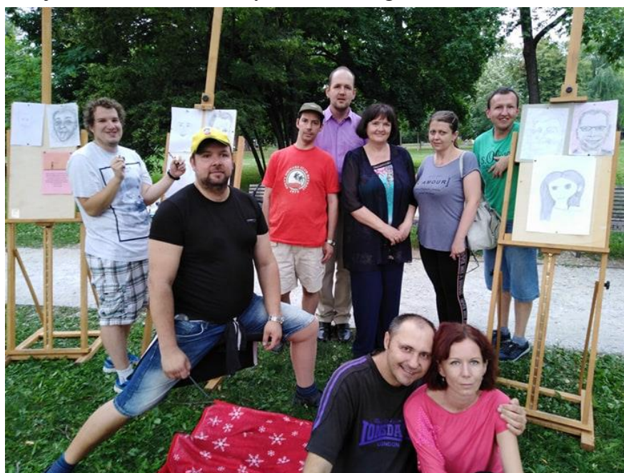
Projekt „Košičania usmiatych tvárí“, August 2019