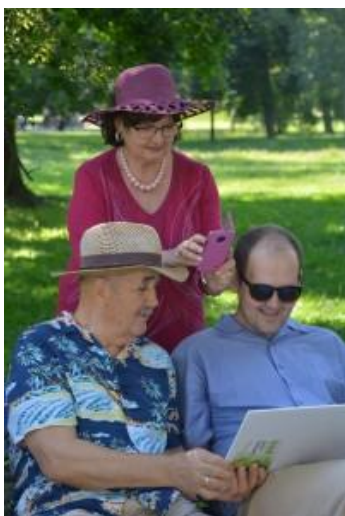
Kultúrne leto „Maľujeme v parku“, Júl 2019