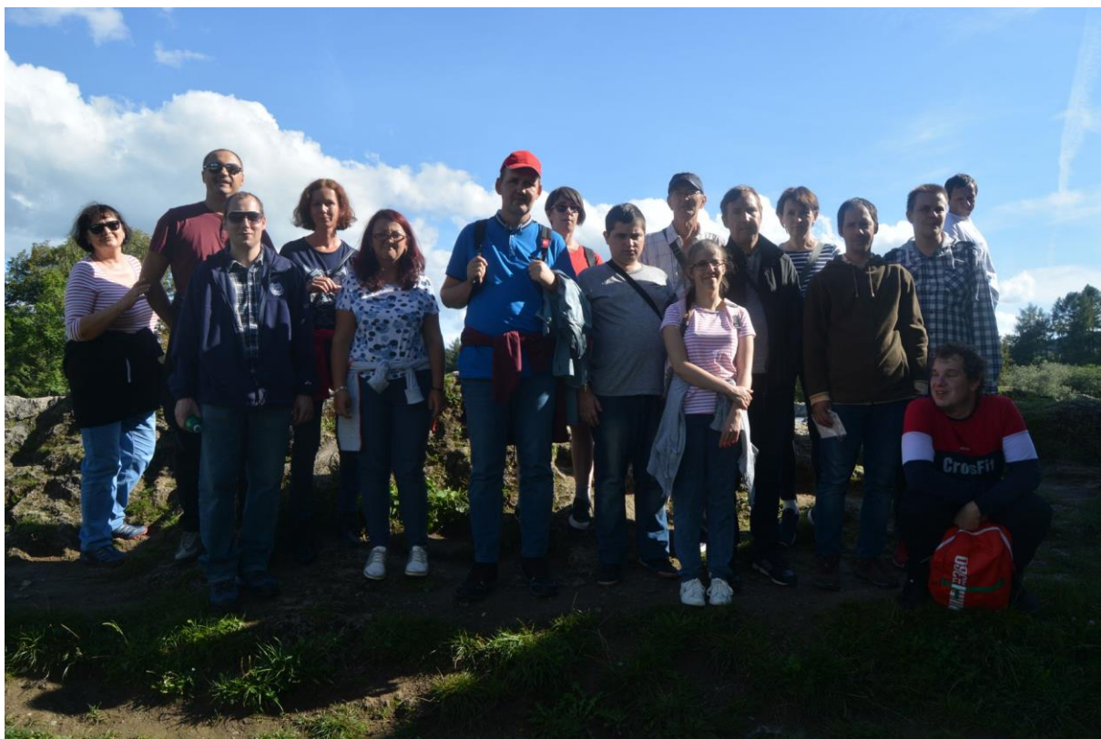
Sociálno-integračná aktivita, Liptovský Mikuláš, múzeum J.Kráľa, September, 2019